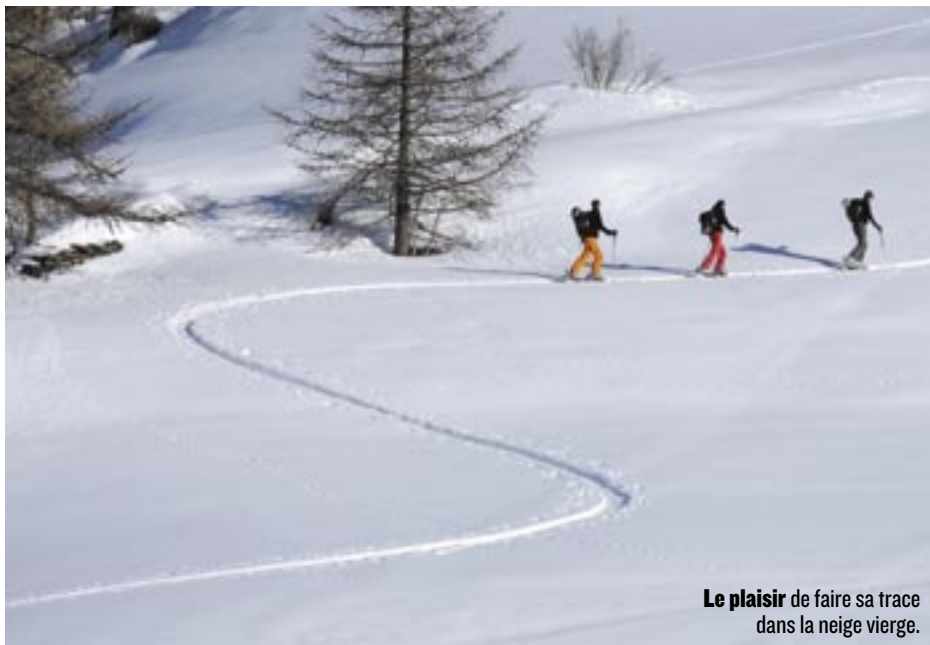
Le plaisir de faire sa trace dans la neige vierge.