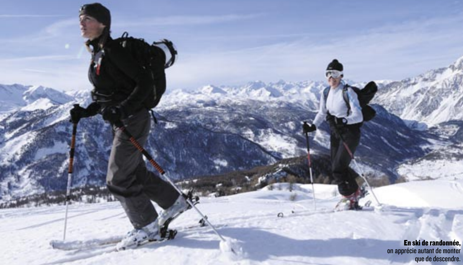
En ski de randonnée, on apprécie autant de monter que de descendre.