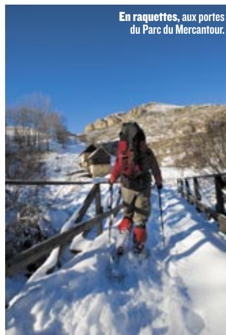
En raquettes, aux portes du Parc du Mercantour.

Chaussés de raquettes, les promeneurs s'adonnent aussi à cette contemplation. En réservant, par exemple, une demi-journée « Traces douces » pour découvrir avec un garde-moniteur du Parc national des Ecrins (05) la faune des vallées du Valgau-