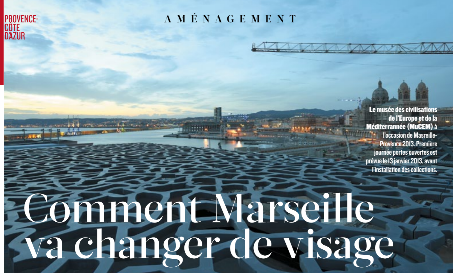
Le musée des civilisations de l'Europe et de la Méditerranée (MuCEM) à l'occasion de Marseille-Provence 2013. Première journée portes ouvertes est prévue le 13 janvier 2013, avant l'installation des collections.