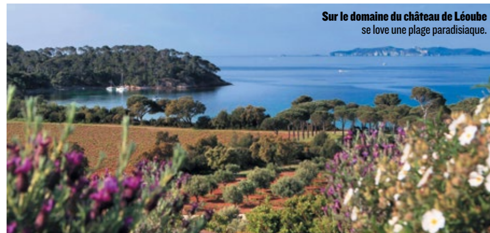
Sur le domaine du château de Léoube se love une plage paradisiaque.

Dégustations de vins et d'huiles tous les jours. De 9 heures à 19 h 30 ( www.chateauléoube.com ).